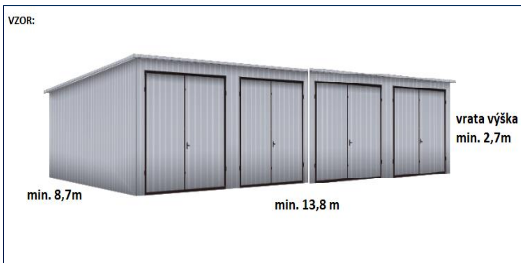
VZOR (ilustrační obrázek) 1

požadavku na garáž je vybavení 2 ks dvoukřídlých plechových nezateplených vrat s minimální šířkou 3,0m a minimální průjezdnou výškou 2,7m. Barva fasády – světle šedá; vnitřní barevné provedení stěn v bílé barvě; barva atiky, okapového systému a vrat – antracit; barva střechy – šedá G9006. Fasáda bude ošetřena strukturovanou pryskyřičnou omítkou se zrnitostí min 2mm. Vnitřní stěny budou ošetřeny hladkým akrylátovým nástřikem.