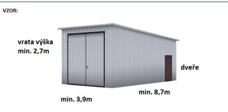
VZOR (ilustrační obrázek) 2